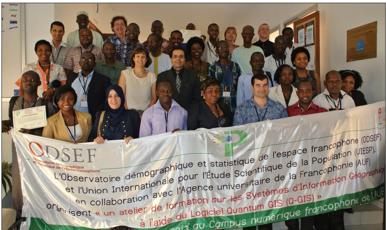
Photo 1. Participants, formateurs et invités, après la remise des attestations.

Il est d'abord important de souligner l'excellence du travail des organisateurs et des facilitateurs. Le travail de l'équipe de formateurs et l'investissement personnel exemplaire des participants ont également contribué à faire de cet atelier un grand succès. Les photos ci-dessous témoignent de l'ambiance amicale qui régnait tout au long de la formation et de la qualité des infrastructures d'accueil.